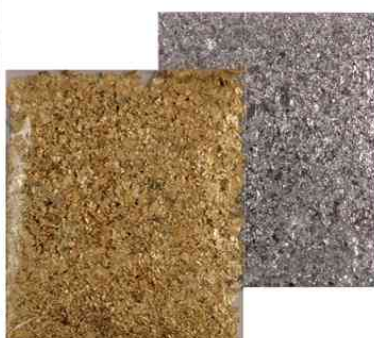
Blattmetall-Flocken Home Design ART DECO